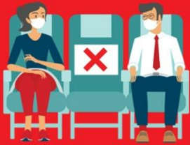
สายการบิน