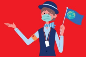
ไกด์ใส่แมสตลอดเวลา