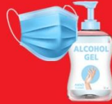
แจกแมส, เจล