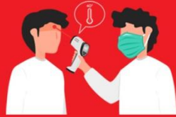
วัดไข้ผู้เดินทาง